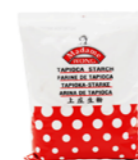
Farine de tapioca