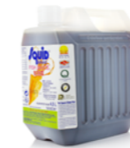
Sauce de poisson seiche Squid