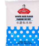
Farine de riz

Marque: MADAME WONG Réf: 522541/520602 木薯粉