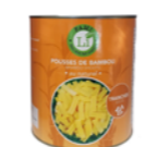
Pousses de Bambou en tranches au naturel