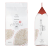
Riz parfumé jasmin Hom Mali