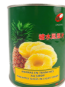
Ananas en tranches