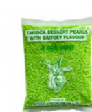
Tapioca perle pandan