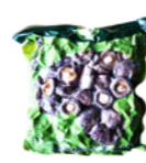
Champignon parfumé sèche AB